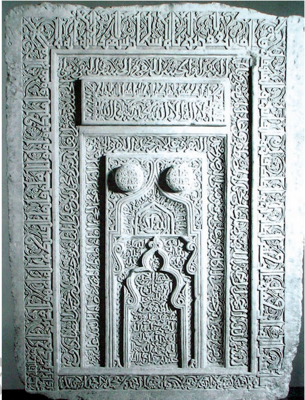
تصویر ۱- کتیبه سنگ قدمگاه مسجد توران پشت به خط کوفی گدار و ثلث و نسخ، حجاری شده، سده ششم هجری قمری