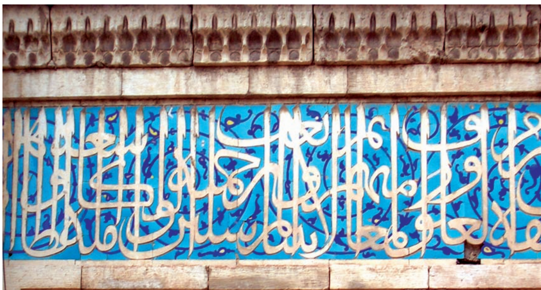
تصویر ۶- کتیبه ثلث ترکیب سنگ و کاشی از مسجد جامع عتیق شیراز، به تاریخ ۷۰۲ هجری قمری، ماخذ تصویر: نگارنده

تأثیرات تحولات خوشنویسی (خط ثلث) بر کتیبه نگاری اپنیه اسلامی ایران سده چهار تا نهم هجری