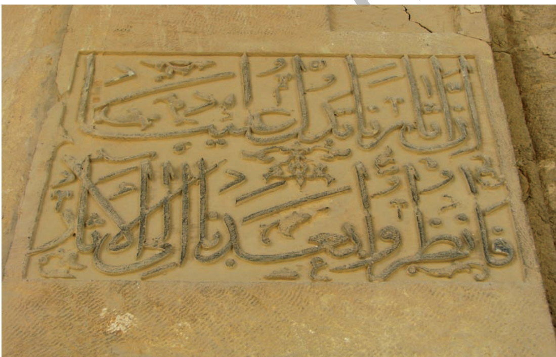
تصویر ۷- کتیبه حجاری به خط ثلث بر جرز خدایخانه مسجد عتیق شیراز، نگارش پیرمحمد، سده نهم هجری قمری

طبقه است به طوری که در هر طبقه قواعد کرسی بندی ثلث رعایت شود. برای این کار لازم است که الف ها و حروف عمودی بلندتر از اندازه کتابتی باشد. پس وجه افتراق کتابت و کتیبه نگاری در این دوران همین نکته است و گرنه چنان که دیدیم از سده هشتم اغلب کتیبه نگاران خود مصحف نویس و خوشنویس بودند و قواعد خوشنویسی را در کتیبه نگاری نیز رعایت می کردند. این قواعد بیش تر در نگارش مفردات و کرسی بندی و حسن مجاورت حروف مشاهده