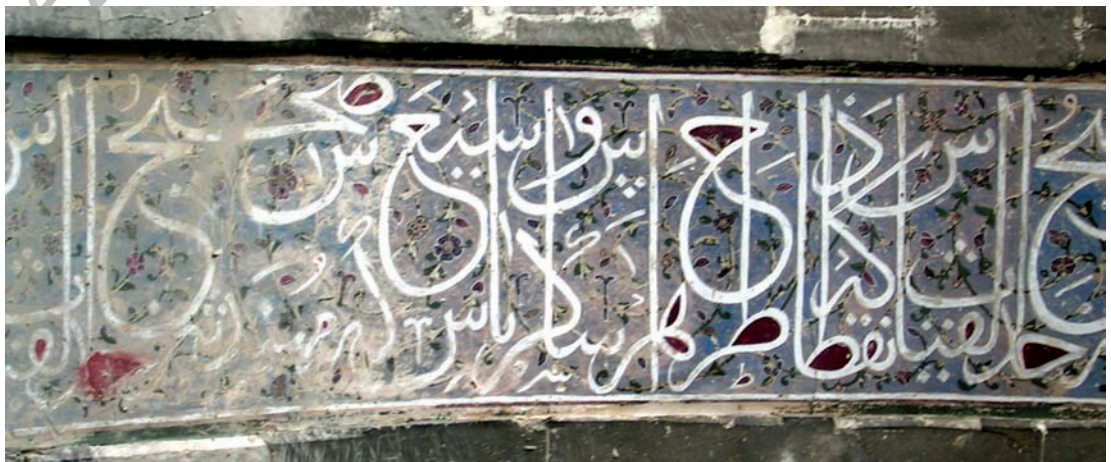
تصویر ۵- کتیبه نقاشی روی گچ از مسجد جمیع عتیق شیراز، احتمالاً سده هشتم هجری قمری

خوشنویسی به طرز نسبتاً دقیقی افزایش پیدا کرده است. از زمان این بواب یعنی آغاز سده پنجم هجری قمری تا یاقوت مستعصمی یعنی سده هفتم هجری قمری تحولی اساسی در نگارش قلم های ثلث و محقق روی نداد. اما از زمان یاقوت و رواج شیوه یاقوتی و نیز هم زمان با گسترش کار خوشنویسان در کتیبه نگاری تحولی اساسی در کار کتیبه نگاری ثلث مشاهده می شود. هرچند در سده هشتم هم چنان آثاری ساخته می شد که از حیث رعایت قواعد خوشنویسی چندان مورد توجه نیست، آثار زیادی هم وجود دارد که به دست خوشنویسان نامی و با کیفیت عالی و گاه ممتاز کتابت شده است. در سده نهم اغلب کتیبه های بناهای مهم به دست مهم ترین خوشنویسان آن عصر نوشته شده است.