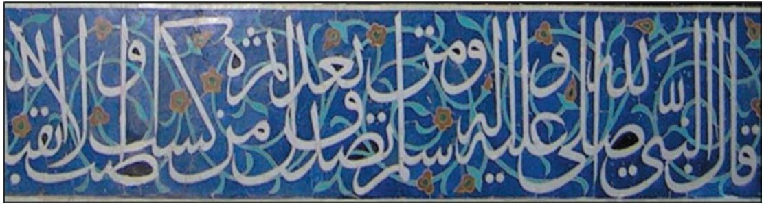
تصویر ۸- کتیبه کاشی معرق به خط ثلث، سر در مقبره ابو مسعود، سده نهم هجری قمری

شاگردانش از قلم های ششگانه - به ویژه نسخ و ثلث و محقق- در کتابت، مصاحف از این خطوط تا آغاز سده هفت کم تر در کتیبه نگاری استفاده می شد، اگر هم شده برای متن هایی غیر اصلی و نه چندان مهم مانند رقم و تاریخ ساخت و غیره بوده است. این موضوع نشان می دهد که اگر آغاز سده ششم را زمان رواج قلم های ششگانه و به ویژه ثلث در میان خوشنویسان بدانیم تا زمان رواج تدریجی آن در نگارش کتیبه ها، یعنی اواسط سده هفتم حدود یک صد و پنجاه سال فاصله وجود دارد که نشانه دگرگونی های خوشنویسی تا تاثیرگذاری بر کتیبه نگاری نیازمند زمان است و نمی توان در این سال ها به دنبال اثرات انی خوشنویسی بر کتیبه نگاری بود. این مساله نشان می دهد در این دوره - سده های چهار تا پایان سده شش و آغاز سده هفتم هجری قمری- هنوز خوشنویسان در کتیبه نگاری چندان دستی نداشتند و بیش تر کتیبه ها توسط کسانی نوشته شده که اغلب صنعت گر و سازنده کتیبه بودند. اما این نسبت در سده های هشت و نهم هجری قمری دگرگون شده و چنان که مشاهده شد بیش تر کتیبه نگاران، خوشنویسان چیره دست زمان خویش بودند و بی شک هر