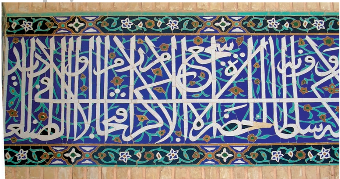
تصویر ۹ - کتیبه کاشی معرق به قلم ثلث که در دو طبقه نوشته شده و در هر طبقه قواعد کرسی بندی تا حدی رعایت شده است، سردر مسجد دریکوشک اصفهان، آغاز سده دهم هجری قمری

در جدول ۱ که مربوط به آثار سده های چهارم و پنجم هجری قمری می باشد تمام کتیبه ها به خط کوفی است، در جدول ۲ که آثار سده های شش و هفت را در برمی گیرد شمار آثار کوفی کاهش یافته و بر تعداد آثار ثلث و محقق افزوده شده است. در جدول ۳، از آثار سده های هشتم و نهم کم تر اثری وجود دارد که به خطی به جز ثلث کتابت شده باشد. اگر همین بررسی را در خوشنویسی انجام دهیم خواهیم دید که کتابت مصاحف به خط کوفی تا پایان سده ششم است و از سده هفت و به ویژه ظهور یاقوت مستعصمی و شاگردانش تقریباً تمام مصاحف به خط ثلث و محقق و ریحان و نسخ نوشته می شده و کتابت ترقیمه ها با رقاع و توقیع. از خط نسخ هم افزون بر کتابت قرآن در کتابت دیگر متون به سبب سهولت در نوشتن و خواندن استفاده می شد. از پایان سده ششم به طور قطع کاربرد خط کوفی به علت مشکلاتی که در کتابت و خواندن داشت، در مصحف نویسی دچار رکود شد و قلم های ششگانه جای آن را گرفت. از آغاز سده پنجم علی رغم استفاده خوشنویسانی هم چون ابن بواب و