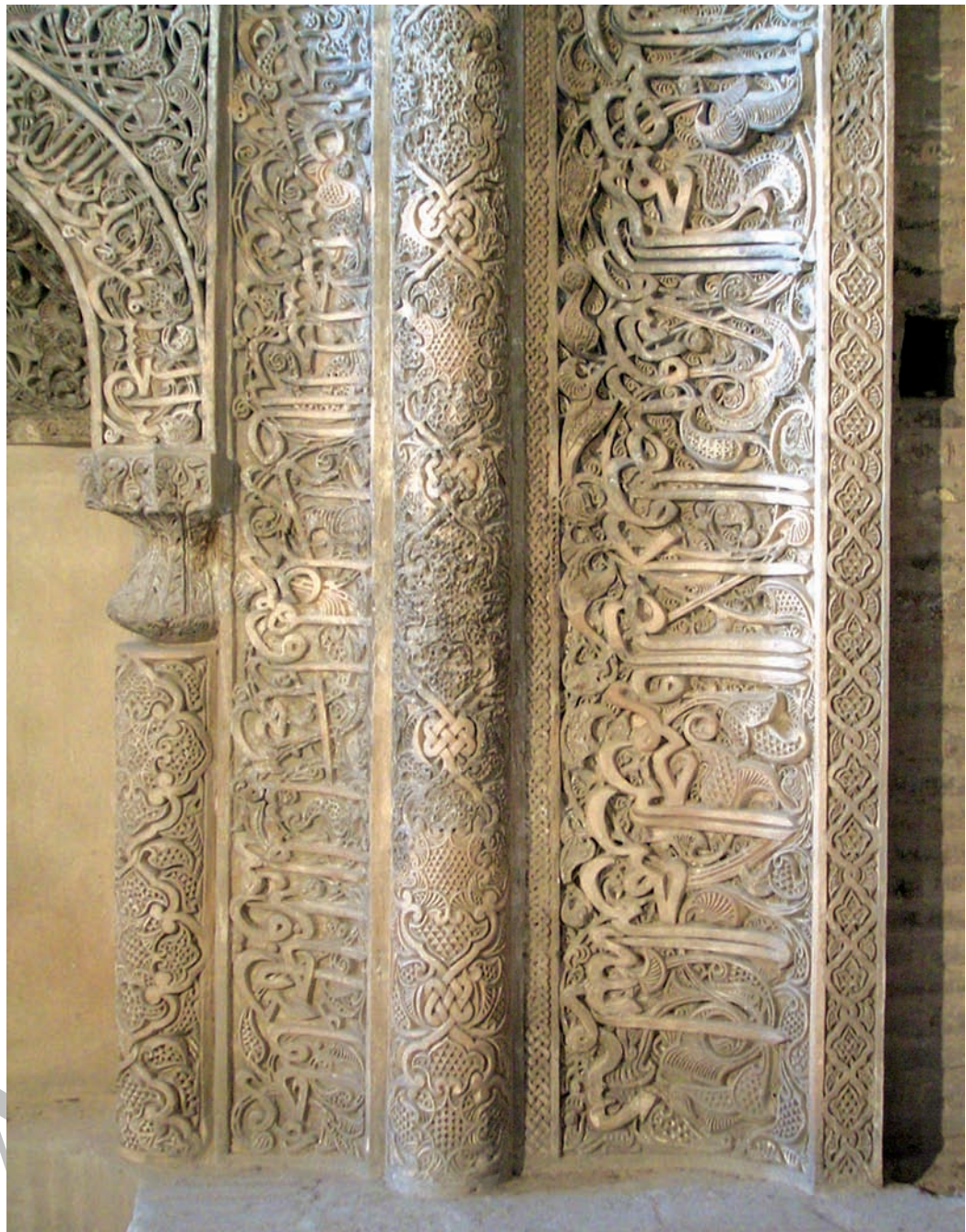
تصویر ۲- قسمتی از حاشیه نخست و طاق نمای محراب الجایتو به خط ثلث، گچ بری، مسجد جامع اصفهان، سده هشتم هجری قمری، ماخذ تصویر: نگارنده.